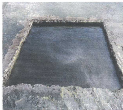
Pemadaman selesai/api padam