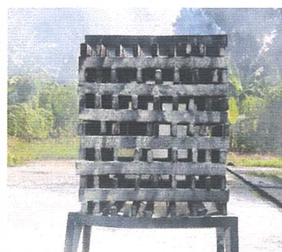
Pemadaman selesai/api padam