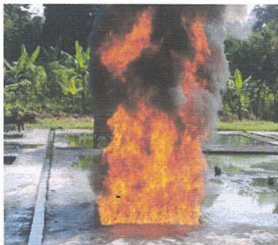
Awal pra pembakaran